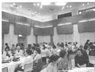
愛餐会には神学生の皆様も参加。 良い交わりの時となりました。

何より嬉しかったのは、現在休会中の長崎教会女性会を多くの人が気にかけてくれていたこと知ったこと。そして他教会の皆様への祈りに支えられていると肌で感じたこと。総会で実感したのは教会ごとの事情や様々な考えがあること。それでもイエス様の十字架を共に仰ぎ見ていれば分裂はないということ。礼拝や講演を通して与えられたのは、主イエスの溢れるほどの愛と恵みへの感謝と喜び。懇親会や食事の交わりで与えられたのは、主イエスにあつてつながっていることの確信。「福音を輝かせましょう」という講師の言葉を胸に長崎教会での歩みを続けていきたい。