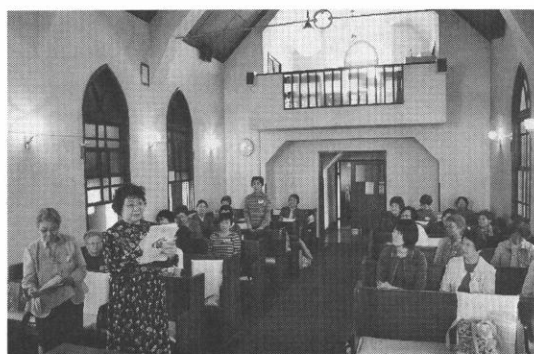
さまざまな意見ができました

会長とは名ばかりの弱い私で本当に申し訳なく思っております。教会の姉妹や牧師夫人が助けてくださっています。集まっている役員さんを見見するとマリアの賛歌を思い出します。色々の協議案は神様が示して下さいと思ひ、役員さんを心から応援しています。