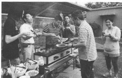
バーベキューを楽しむ青年たち