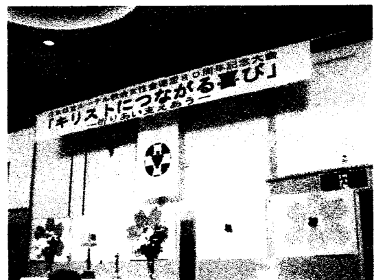
パネルディスカッション・グループ寄せ書き